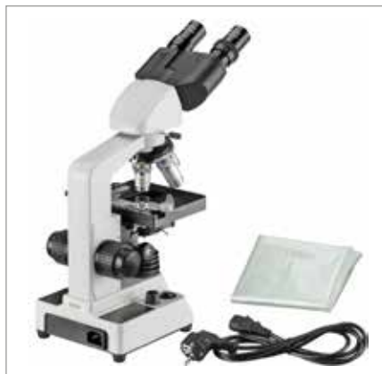
Netzanschluss bei Modellen B-304 – B-307 mit robustem Kaltgeräteanschlusskabel. Zu jedem Mikroskop wird eine Staubschutzhaube mitgeliefert.