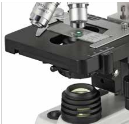
Objektisch mit Kondensator 300er Serie