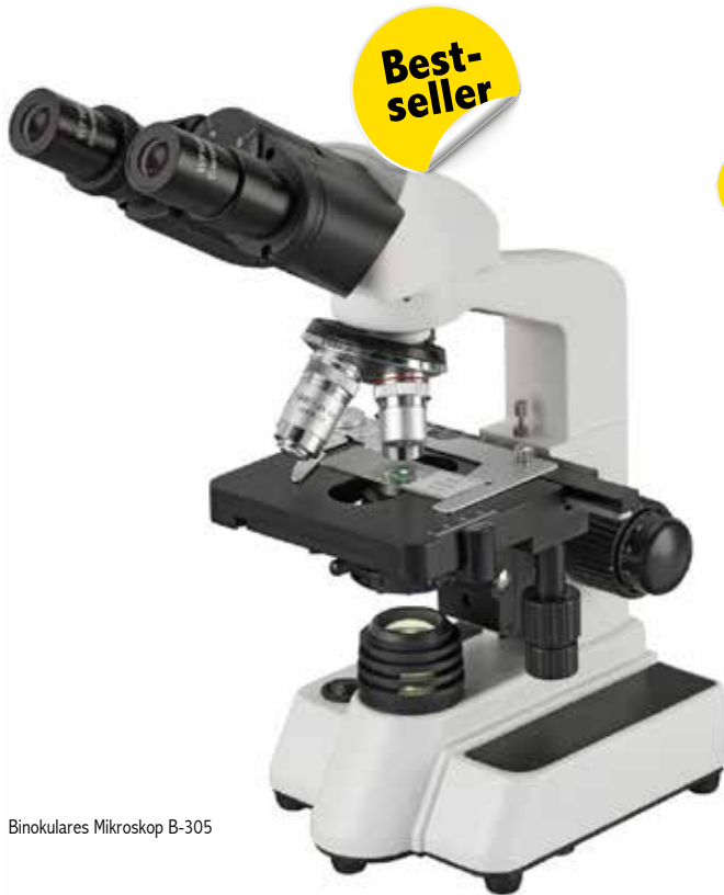
Binokulares Mikroskop B-305