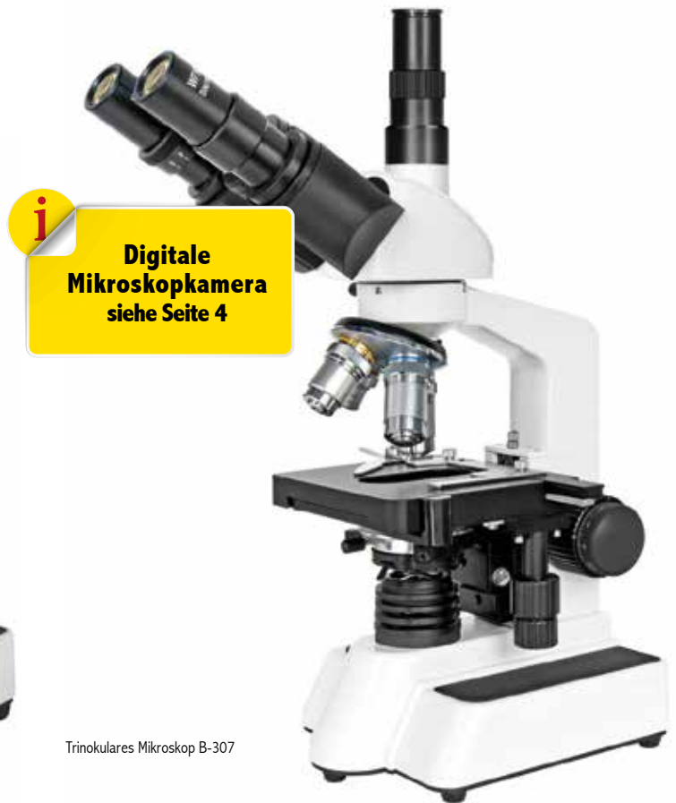
Trinokulares Mikroskop B-307