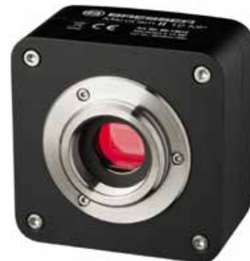
Digitale Mikroskopkamera B-DC 12