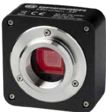
Digitale Mikroskopkamera B-DC 5