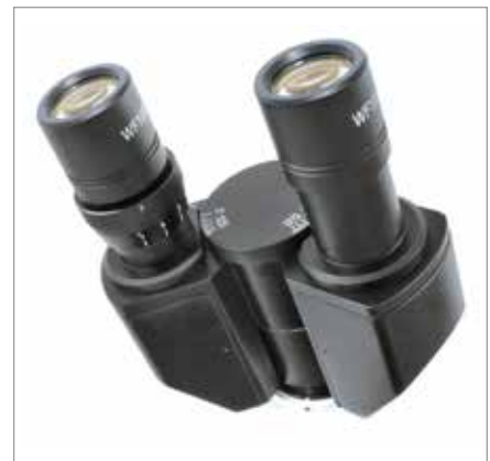
Der Binokulareinblick verfügt über eine Dioptrienverstellung am linken Tubusstutzen.